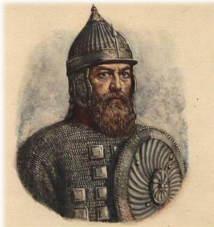
ПОЖАРСКИЙ ДМИТРИЙ МИХАЙЛОВИЧ

Подвиг Минина и Пожарского, добровольческая деятельность которых остановила тяжелейшую польскую интервенцию в тот момент, когда на краю гибели была не только русская государственность, но и сама русская национальность.