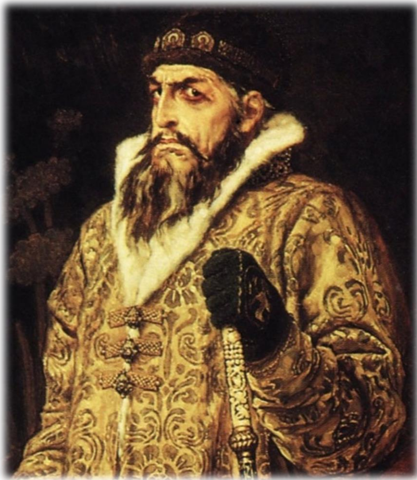
1551 г.- царь Иван Васильевич Грозный