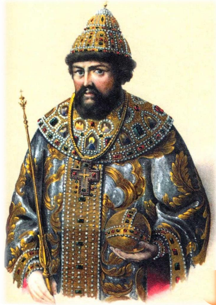
1649 г.- царь Алексей Михайлович