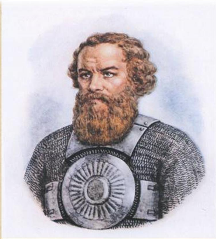
МИНИН КУЗЬМА МИНИЧ