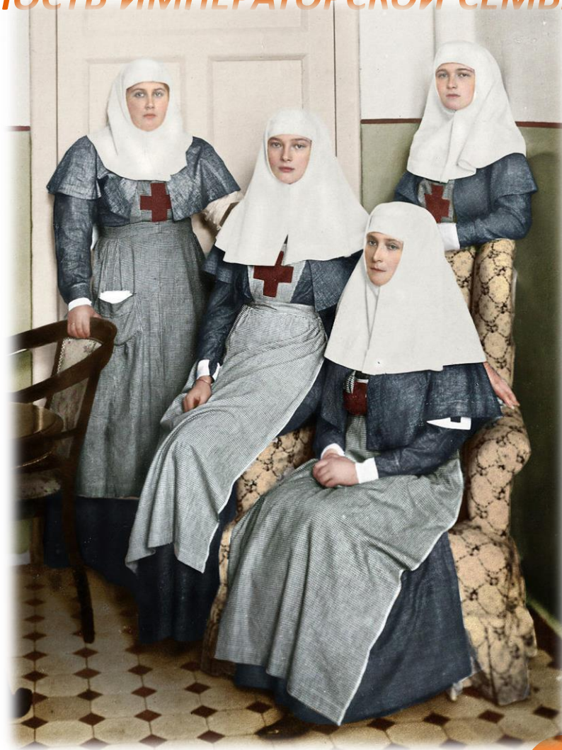
Сестры Романовы с царицей Александрой работают в военном госпитале во время Первой мировой войны.

Следующим этапом развития волонтерства (1750-1917 гг.) стала форма социального служения – благотворительность, формы и принципы которой определяются членами императорской семьи и церковью. Появляются сиротские дома при храмах. Ведомства благотворительных учреждений взяло под свою опеку все воспитательные дома, а также почти все образовательные учреждения для детей.